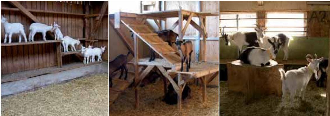
Abbildung 30: Verschiedene Klettermöglichkeiten oder erhöhte Bereiche