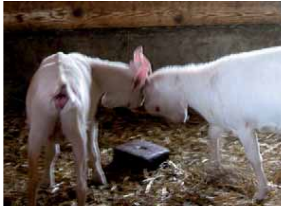
Abbildung 8: Kitze beim sozialen Spiel. Auch bei ausgewachsenen Ziegen kommt spielerisches Kämpfen vor.

Der Rang eines Tieres kann sich auf den Stress und die Leistung auswirken. Ungünstige Bedingungen im Stall und Management, z.B. zu wenig Fressplätze und zu wenig Futter, wirken sich vor allem auf rangniedere Tiere aus, die dann ihre Bedürfnisse nach Futter, Ruhe etc. nicht oder nur eingeschränkt decken können. Dies trifft sowohl für hornlose, behornte als auch gemischte Bestände zu. Bei rangniederen Tieren kann es so durch sozialen Stress zu deutlichen Verlusten in der Milchleistung kommen (manche Quellen sprechen von 10 bis 50 Prozent).