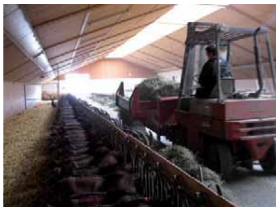
Abbildung 40: Häufige Futtervorlage ist günstig.