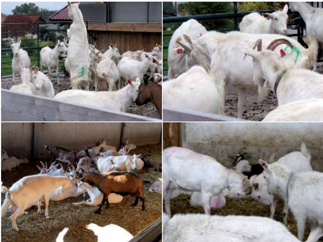
Abbildung 7: Drohen, Schieben mit den Köpfen / Hörnern und Zusammenstoßen der Köpfe mit den Hörnern bzw. der Stirn, teilweise mit vorherigem Aufsteigen auf die Hinterbeine vor dem Zusammenprall, gehören zu Rankämpfen.

Wenn neue Tiere in die Herde kommen, oder ganze Herden miteinander gemischt werden, müssen die Dominanzbeziehungen geklärt werden. Nicht alle Tiere müssen hierfür Rankämpfe austragen, aber die Häufigkeit der aggressiven Auseinandersetzungen steigt deutlich an. Auch in stabilen Herden kann es zu Auseinandersetzungen kommen, da heranwachsende Tiere einen neuen Platz in der Rangordnung einnehmen wollen. Allerdings sind hier die Dominanzbeziehungen oft über Jahre stabil.