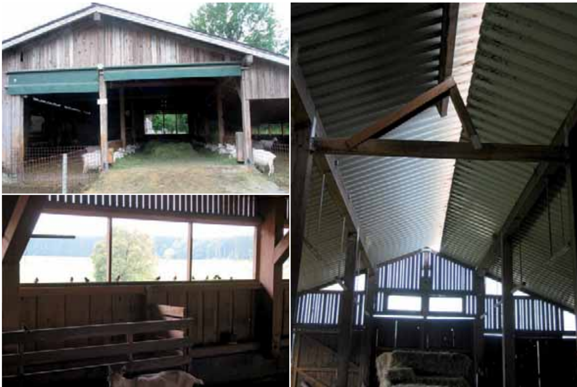
Abbildung 49b: Viel Licht und gute Belüftung sind wichtig.

Kratzbürsten: Kratzbürsten dienen der Körperpflege der Ziegen und sollten in ausreichender Anzahl vorhanden sein, um keine zusätzlichen Konkurrenzsituationen hervorzurufen.