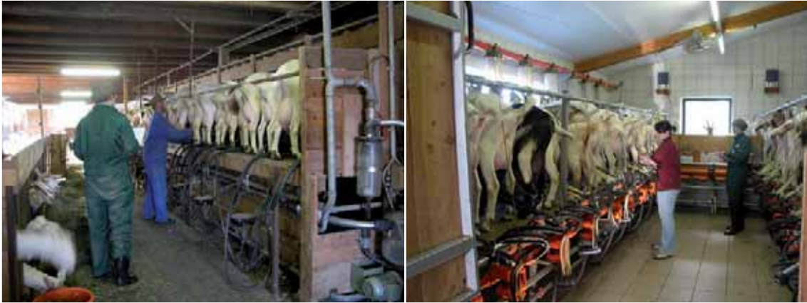
Abbildung 52: Beispiele für Melkstände