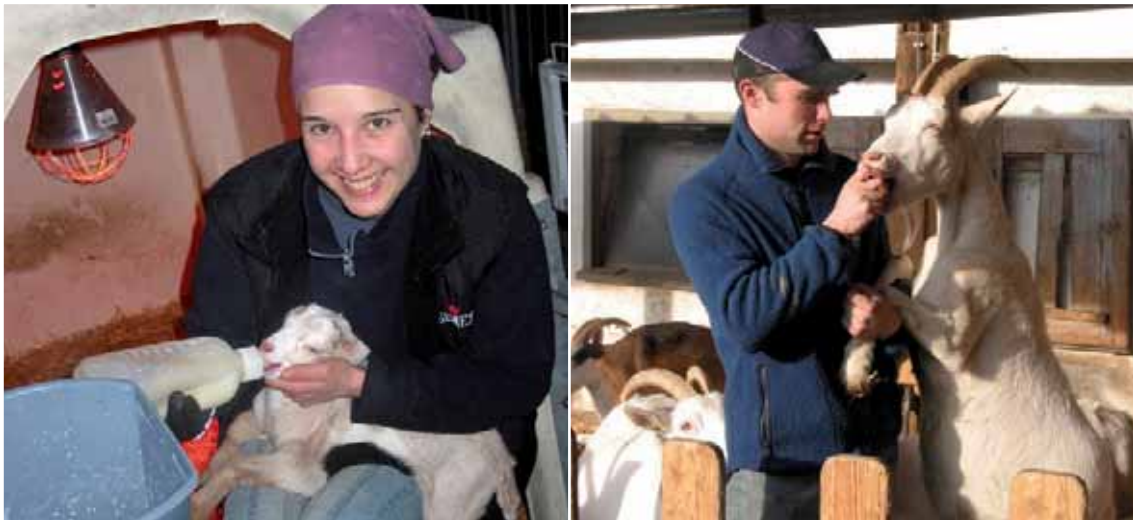
Abbildung 55: Früher positiver Umgang (links) und Belohnungen (rechts) erleichtern die Handhabung

Positiver Kontakt von Anfang an: Die weit in der Praxis verbreitete Methode der mutterlosen Kitzaufzucht kann als Grundstein für ein gutes Mensch-Tier-Verhältnis genutzt werden, indem regelmäßiger positiver Kontakt gepflegt wird. Die Tiere sind dann in Anwesenheit des Menschen ruhig. Doch auch bei muttergebundener Aufzucht ist eine gute Mensch-Tier-Beziehung möglich – die Kitze lernen von den Müttern.