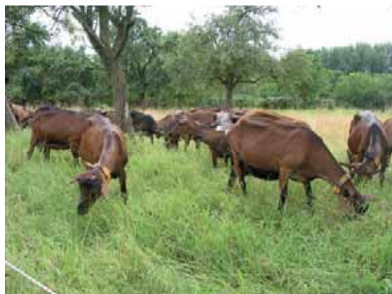
Abbildung 23: Eingliederung auf der Weide reduziert Stress und Verletzungsgefahr durch viel Platz zum Ausweichen und gutes Futterangebot.