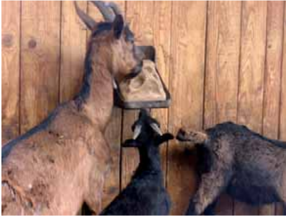
Abbildung 41: Futter schlechter Qualität, unausgewogene Nährstoff-, Mineralstoff- oder Spurenelementversorgung kann die Aggressivität der Tiere erhöhen.