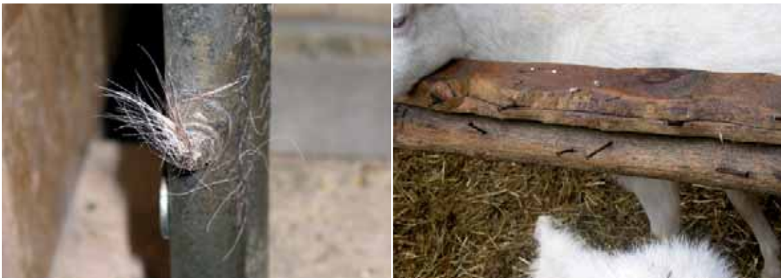
Abbildung 57: Vorstehende Nägel, Schrauben, gebrochene Einrichtungen etc. führen zu Verletzungen.