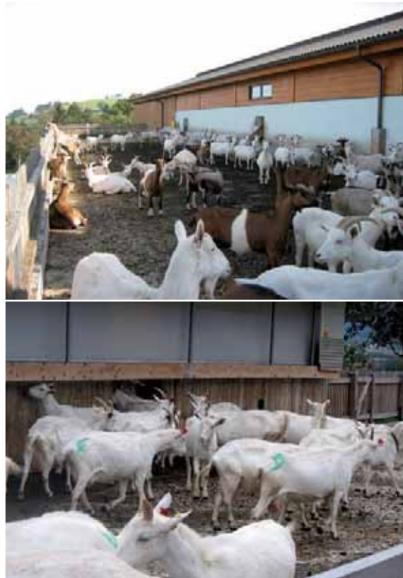
Abbildung 25: Ein Auslauf bietet zusätzlichen Platz zum Liegen, für Bewegung und Rückzug.

Auslauf / Laufhof: Ein Auslauf oder Laufhof hat neben den klimatischen auch große Vorteile für das Sozialverhalten einer Herde. Durch einen Auslauf erhält der Stall eine zusätzliche Strukturierung, die dazu beiträgt, dass rangniedere Tiere in Konfliktsituationen diesen aufsuchen und so Auseinandersetzungen mit ranghöheren Tieren aus dem Wege gehen können. Dies entschärft Konfliktsituationen im Stall und wirkt sich positiv auf das soziale Klima einer Herde aus. Zudem wird die Bewegungsfläche pro Tier erhöht und Sackgasen können durch einen Auslauf aufgelöst werden. Der Auslauf sollte ständig zugänglich sein, nach Möglichkeit mehrere, ausreichend breite Zugänge haben und Klettermöglichkeiten bieten. Tränken können die Attraktivität des Laufhofes deut-