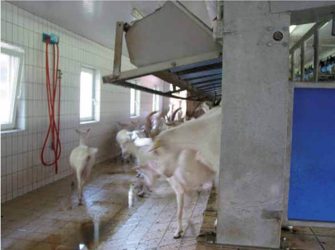
Abbildung 53: Frontaustrieb ermöglicht schnelles Verlassen des Melkstandes