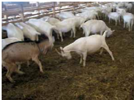
Abbildung 20: Drohen, Stoßen und Kämpfe (siehe auch Abbildung 7) gehören zum Sozialverhalten der Ziegen (siehe oben). Mit Ziegen, die immer wieder durch verletzungs-trächtige Aggressionen auffallen, sollte jedoch nicht weitergezüchtet werden.