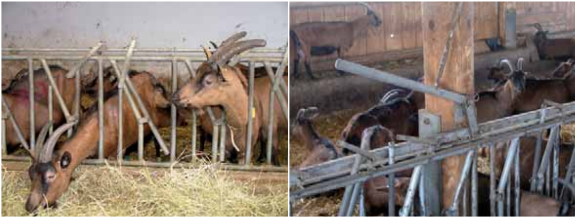
Abbildung 38: Bei Scherenfressgittern müssen behornete Tiere genau ausfädeln, um es zu verlassen.