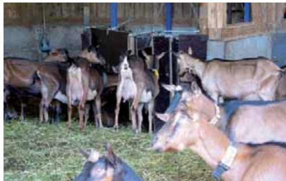
Abbildung 47: Ohne Schutztür besteht am Krafffutterautomaten erhöhte Verletzungsgefahr

Schutztür in Krafffutterautomaten: Krafffutterautomaten sind zwar ernährungsphysiologisch günstig durch die Aufteilung der Krafffutterrationen, können jedoch zu einer erheblichen Unruhe in der Herde führen. Tiere im Krafffutterautomaten können von hinten von anderen Tieren gestossen werden. Um dies zu verhindern, sollte ein Krafffutterautomat mit automatisch verschließender Schutztür montiert werden.