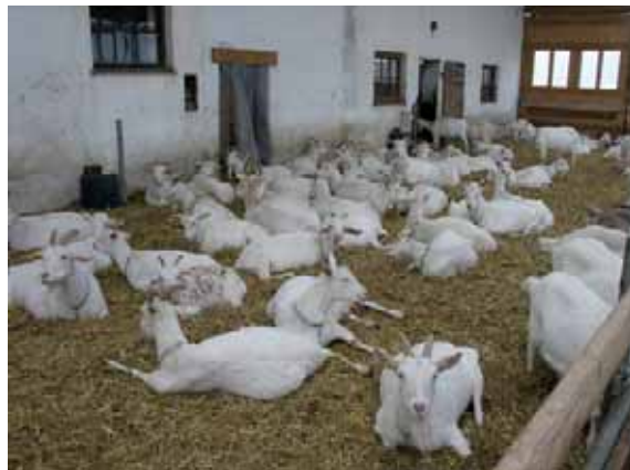
Abbildung 19: In etwas größeren Buchten können Tiere besser eine größere Distanz einhalten.