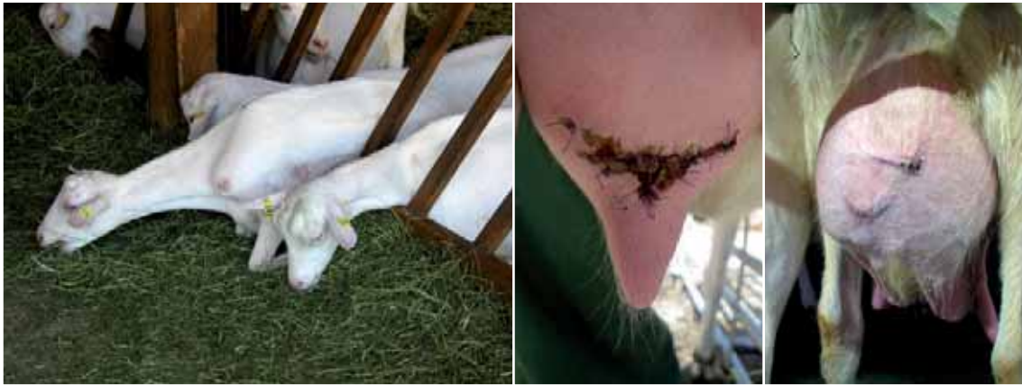
Abbildung 36: Bei größerem Abstand zwischen den Brettern können sich manche Ziegen hindurchzwängen (Foto links) und teilweise beim Zurückziehen steckenbleiben. Solche Situationen stellen ein hohes Risiko für Verletzungen dar – insbesondere in Herden mit behornnten Tieren kann es dabei zu schweren Verletzungen, des Euters kommen (Foto Mitte: frische, genähte, tiefe Verletzung; Foto rechts: teilweise vernarbt)

Nackenrohr/-brett als Fressgitter möglichst vermeiden: Sie sind für Ziegen weniger gut geeignet. Sie bieten keine festen Fressplätze und insbesondere Tiere mit Hörnern haben hier Probleme, das Fressgitter schnell zu verlassen (siehe Abbildung 37). Falls Nackenrohr/-brettfressgitter verwendet werden, ist darauf zu achten, dass ständig Futter zur freien Aufnahme und in gleichbleibender Qualität vorliegt. In der Jungtieraufzucht können sie bei ausreichendem Fressplatzangebot eingesetzt werden, da die Rangbeziehungen bei Jungtieren noch nicht so ausgeprägt zum Tragen kommen und die Leistungsanforderungen an die Tiere geringer ist.