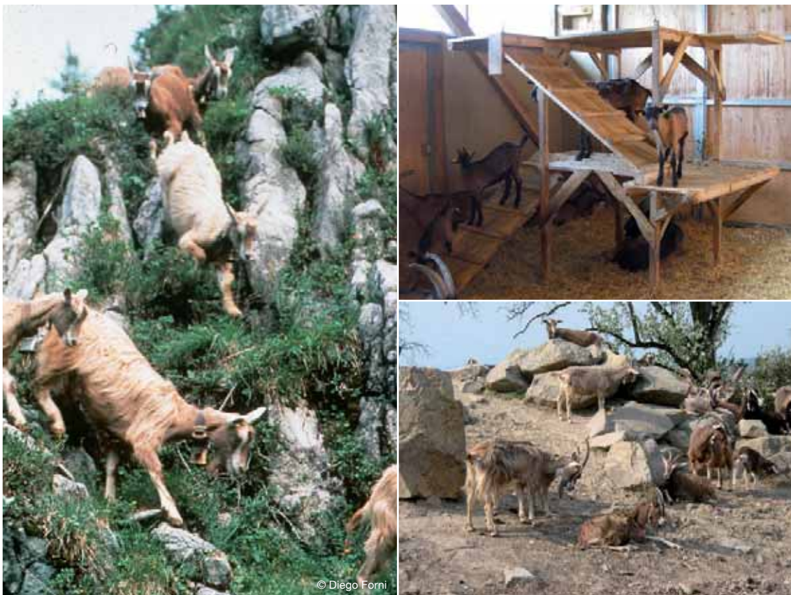
Abbildung 2: Ziegen stammen aus Hochgebirgsgegenden, in denen sie viel klettern müssen (links Milchziegen auf der Alp). Klettermöglichkeiten bei der Haltung fördern daher das Wohlbefinden der Ziegen (Mitte: Kletterturm im Stall; rechts: Auslauf mit Felsen zum Klettern).

Um Ziegen im Laufstall erfolgreich halten zu können und Stress und Verletzungen zu minimieren, muss ihr natürliches Sozialverhalten, die dahinter stehende Motivation und deren Auswirkungen verstanden werden. Dieses Wissen muss dann bei der Planung und Ausgestaltung des Laufstalles und beim Herdenmanagement umgesetzt werden, um den Bedürfnissen der Tiere Rechnung zu tragen.