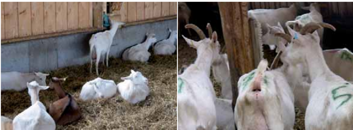
Abbildung 10: Viel Platz um die Tränke oder Bürsten ist günstig, die Tränke ist jedoch zu hoch angebracht (eine Antrittsstufe wäre hier günstig).

Gute Anordnung und klare Gliederung der Stallbereiche und der Einrichtung: Plätze mit erhöhter Konkurrenz (z.B. Fressplätze, Tränken, Bürsten) sollten gut im Stall verteilt und jederzeit frei zugänglich sein. Zum Beispiel dicht beieinander liegende Tränkeeinrichtungen erhöhen die Anzahl an Tieren in diesem Bereich und damit die Gefahr von unnötigen Auseinandersetzungen zwischen den Ziegen. Die Bereiche so anordnen, dass aktive Tiere ruhende nicht stören.