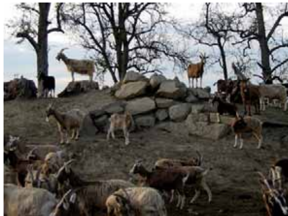
Abbildung 28: Felsige Klettermöglichkeiten im Auslauf sind ideal für die Ziegen