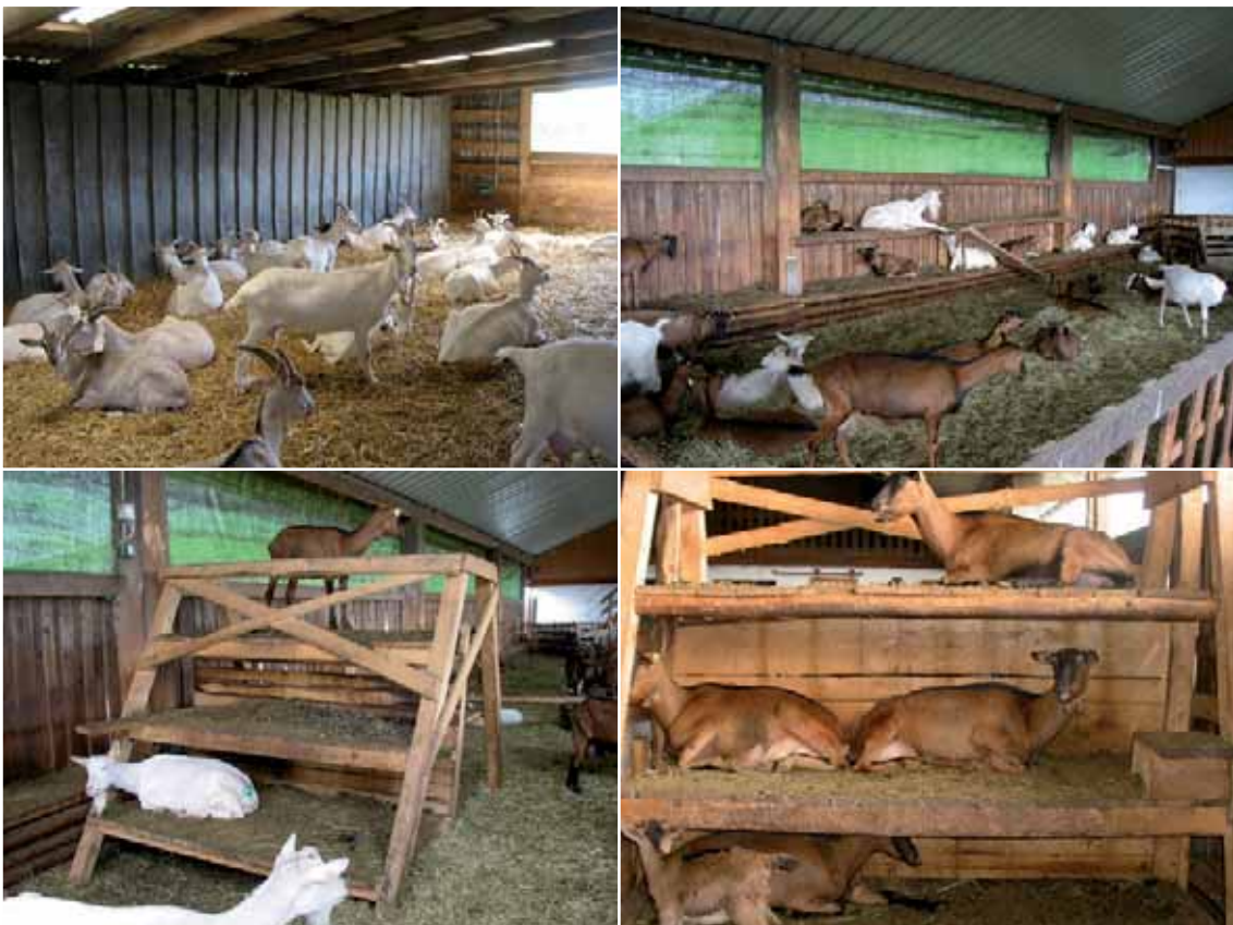
Abbildung 32: Viel Platz zum Liegen ermöglicht allen Tieren ungestörtes Ruhen – optimal ist es noch mit erhöhten Ebenen kombiniert.