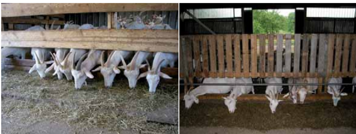
Abbildung 37: Nackenbrett bzw. Nackenrohr

Nackenrohr/-brett als Fressgitter möglichst vermeiden: Sie sind für Ziegen weniger gut geeignet. Sie bieten keine festen Fressplätze und insbesondere Tiere mit Hörnern haben hier Probleme, das Fressgitter schnell zu verlassen (siehe Abbildung 37). Falls Nackenrohr/-brettfressgitter verwendet werden, ist darauf zu achten, dass ständig Futter zur freien Aufnahme und in gleichbleibender Qualität vorliegt. In der Jungtieraufzucht können sie bei ausreichendem Fressplatzangebot eingesetzt werden, da die Rangbeziehungen bei Jungtieren noch nicht so ausgeprägt zum Tragen kommen und die Leistungsanforderungen an die Tiere geringer ist.