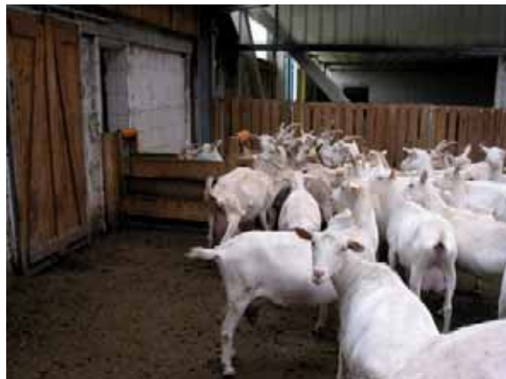
Abbildung 51: Ausreichend Platz im Wartebereich hilft Verletzungen zu vermeiden

Großräumiger Wartebereich: Beengte Platzverhältnisse im Wartebereich insgesamt oder in Teilbereichen (Engstellen, enge Treibgänge) fördern die sozialen Auseinandersetzungen zwischen den Tieren, erschweren ein Ausweichen und erhöhen die Verletzungsgefahr der Tiere. Bei einem Vergleich verschiedenen Flächenangebots im Wartebereich trat bei 0,7 m 2 pro Ziege über mehrere Wochen nur eine Verletzung auf, bei einem Platzangebot von nur 0,4 m 2 / Ziege dagegen sieben Verletzungen (bei insgesamt 66 Ziegen).