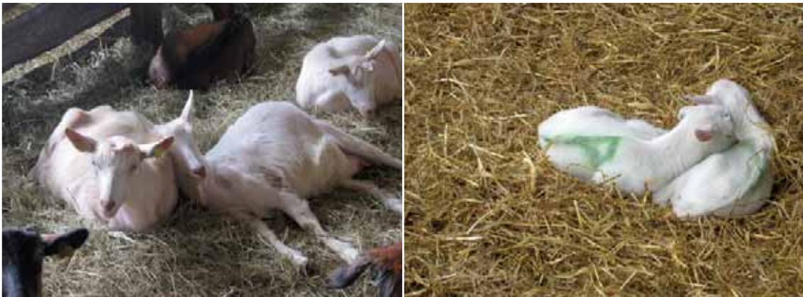
Abbildung 3: Kontaktliegen bei befreundeten Ziegen bzw. Kitzen

Freundliche soziale Verhaltensweisen sind das Suchen bzw. Akzeptieren von Körperkon- takt mit Herdenmitgliedern beim Hinlegen. Dies geschieht bei befreundeten adulten Ziegen, bei Mutter und Kind und von Kitzen untereinander. Die soziale, also gegenseitige, Körper- pflege ist selten zu beobachten und kommt nur zwischen gut befreundeten Ziegen vor. Be- freundete Tiere halten sich häufig nah beieinander auf, und liegen gerne in Körperkontakt zueinander.