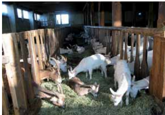
Abbildung 22: Mitlaufende Kitze verringern Aggressionen und Stress bei der Eingliederung. Jungtiere können jedoch meist durch die Fressgitter aus der Bucht springen.