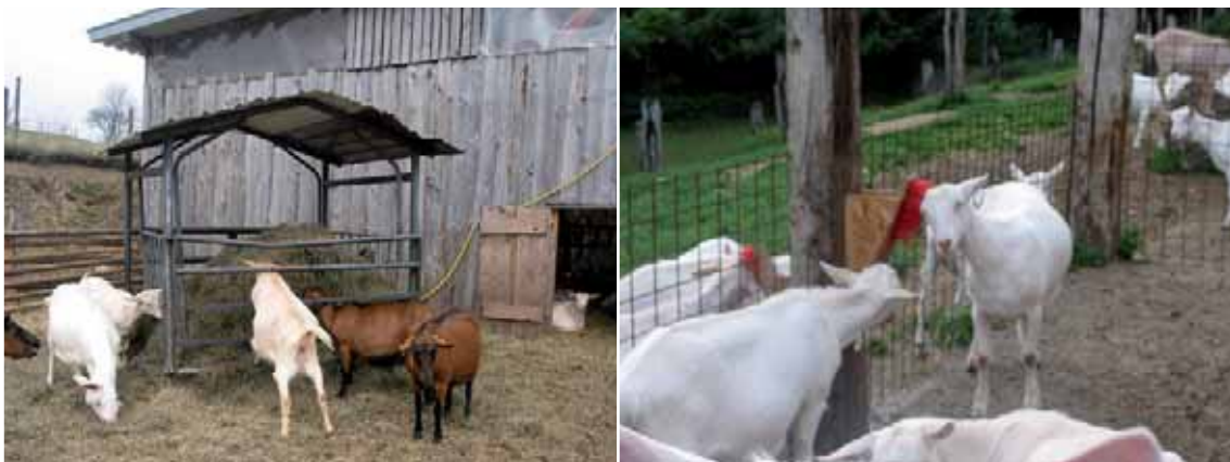
Abbildung 26: Raufen und Bürsten erhöhen die Attraktivität des Auslaufes und entlasten den Stall