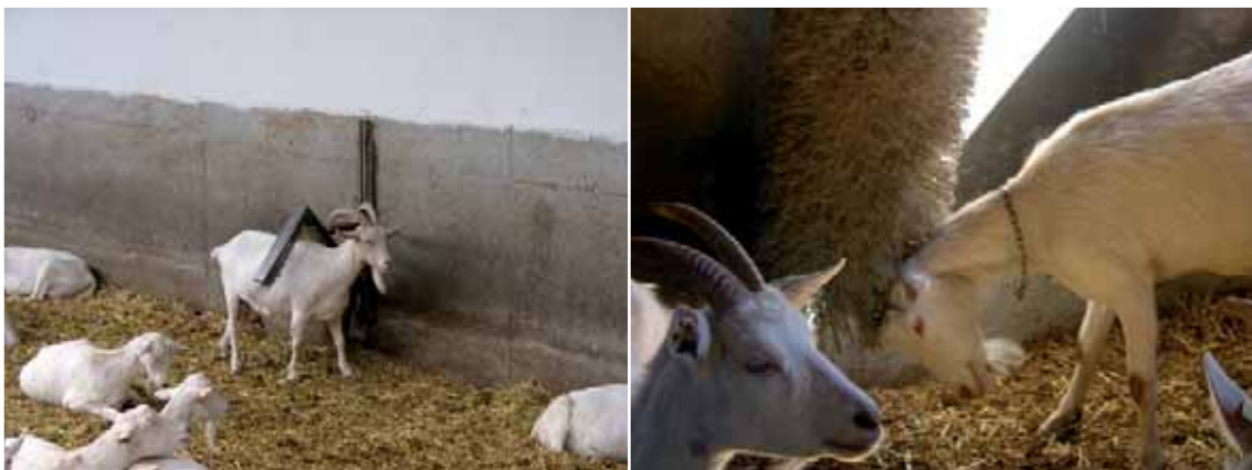
Abbildung 50: Bürsten werden gerne angenommen und fördern das Wohlbefinden.

Auch Scheuerpfähle dienen dem Komfortverhalten durch Kratzen und Scheuern. Es ist darauf zu achten, dass keine Hölzer verwendet werden, die zum Splintern neigen, da dies ein Infektionsrisiko für die Tiere birgt