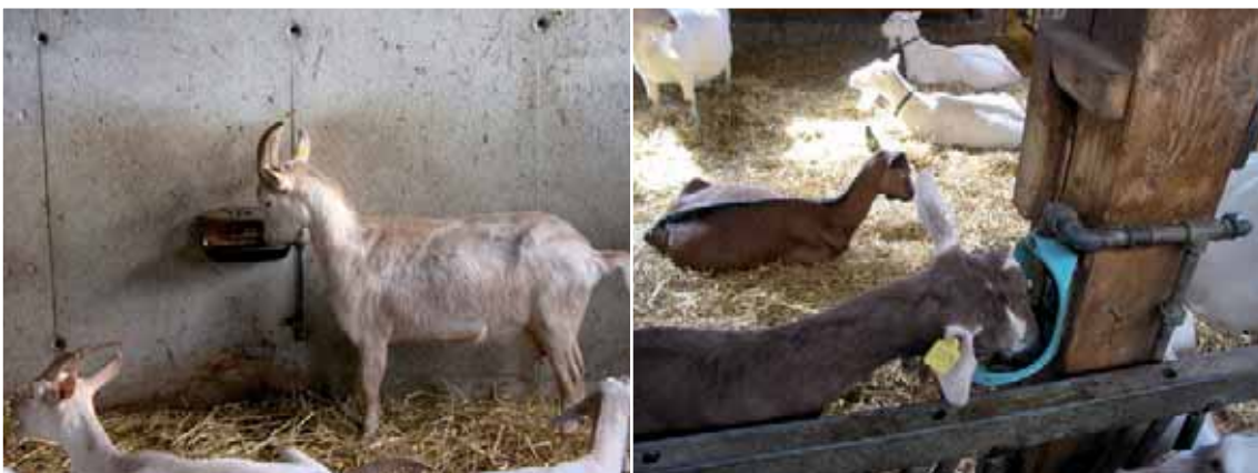
Abbildung 48: Eine ausreichende Anzahl an Tränken vermindert Auseinandersetzungen.

Tränken in ausreichender Anzahl und frei zugänglich: Abhängig von der Anzahl der Tiere die an einer Tränke gleichzeitig Wasser aufnehmen können, ist eine ausreichende Anzahl an Tränken vorzusehen. Dabei ist zu beachten, dass auch längere Trogränken von einem einzigen ranghohen Tier für längere Zeit blockiert werden können, mehrere getrennt angeordnete Tränken dagegen nicht. Bei einer Untersuchung auf Praxisbetrieben gab es weniger Euterverletzungen, wenn den Tieren mindestens eine Tränke pro 25 Ziegen zur Verfügung stand – unabhängig vom Tränketyt – dies ist daher empfehlenswert. In jeder Bucht sollten mindestens zwei Tränken vorhanden sein, da sonst ein Tier den gesamten Zugang zum Wasser blockieren kann. Zudem sollte nur frisches Wasser zur Verfügung gestellt werden. Angewärmtes Wasser im Winter wird von den Ziegen gern angenommen. Auch im Laufhof, Auslauf oder Weide sind Tränken aufzustellen.