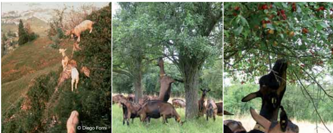
Abbildung 33: Ziegen fressen gerne von Büschen und Bäumen.

Ziegen reagieren sehr empfindlich auf die Qualität des Wassers und lehnen verunreinigtes Wasser ab. Im Allgemeinen bevorzugen Ziegen temperiertes Wasser. Ziegen sind Saugtrinker und trinken von einer freien Wasseroberfläche. Je nach Futterart, Milchleistung und Temperaturen trinken die Tiere bis zu 20 Liter Wasser pro Tag. In gemäßigttem Klima geht man von einem Wasserverbrauch bei laktierenden Ziegen von 3,5 Liter pro Kilo Trockensubstanz Futteraufnahme aus.