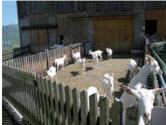
Abbildung 27: Ein sonniger Auslauf ist in den kalten Monaten beliebt.

Klettermöglichkeiten / erhöhte Aktivitätsbereiche: Ziegen bewegen sich viel, klettern und springen auf Gegenstände. Deswegen sollten ihnen Klettermöglichkeiten und erhöhte Bereiche angeboten werden. Ein solches Angebot wird stark genutzt und dient auch der Strukturierung des Stalles.