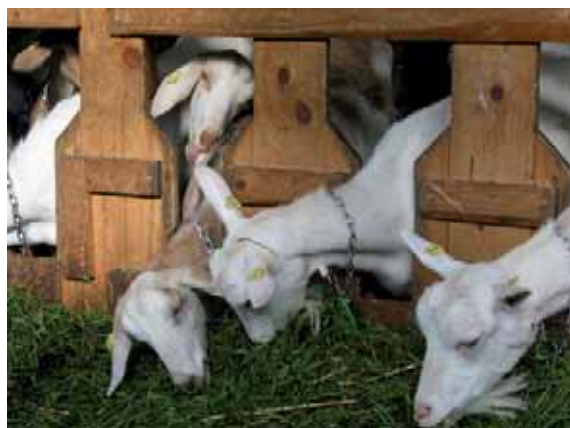
Abbildung 44: Schwedenfressgitter sind nur bedingt für behornete Ziegen geeignet: das horizontale Abschlussbrett muß weit über den Köpfen der Ziegen angebracht sein und die Fressplatzbreite und damit der Abstand zwischen den Brettern oben breit genug, damit sich die Ziegen nicht mit den Hörnern verhaken (für Maße siehe Keil und Pommereau 2013, ART-Baumerkblatt Nr. 02.01). Das Beispiel ist nicht für behornete Tiere geeignet.