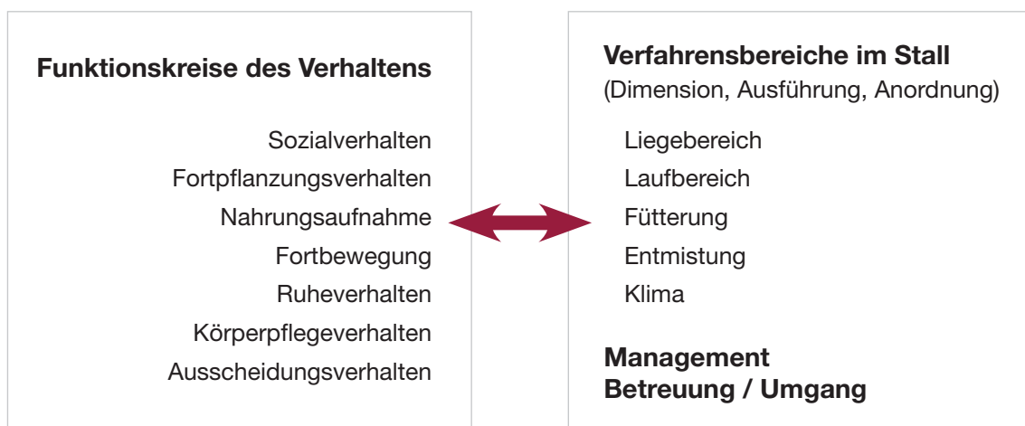
Abbildung 1: Die verschiedenen Bereiche im Stall, Management und Betreuung müssen so gestaltet sein, dass sie den Ziegen artgemäßes Verhalten ermöglichen.

Eine optimierte Haltung bedeutet, die Verfahrensbereiche im Stall (Liegebereich, Laufbereich, Fressbereich, Entmistung, Lüftung) in Abmessungen, Anzahl und Anordnung, sowie das Management dem Verhalten der Tiere in den verschiedenen Funktionskreisen (Sozialverhalten, Futteraufnahmeverhalten, Ruheverhalten etc.) entsprechend anzupassen (Abbildung 1 und Abbildung 2).