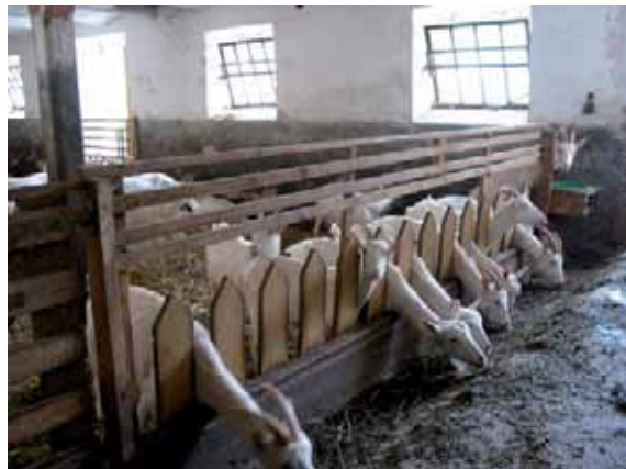
Abbildung 39: Gibt es weniger als 10 Prozent Futterreste ist die Fütterung rationiert.

Sind die Ziegen satt, sind sie auch ruhiger. Um die Konkurrenzsituation am Fressplatz zu minimieren ist es sinnvoll, mindestens dreimal am Tag frisches Futter vorzulegen. Ist das Grundfutter nicht von bester Qualität sollte noch häufiger frisches Futter vorgelegt werden. Dadurch haben auch rangniedere Tiere die Möglichkeit, qualitativ hochwertigeres Futter in ausreichender Menge aufzunehmen.