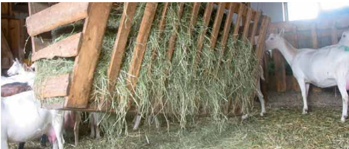
Abbildung 14: Heuraufen zusätzlich zum Fressgitter bieten Sichtschutz und Vermindern die Konkurrenz