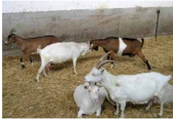
Abbildung 21: Bei einer Neugruppierung müssen die Rangplätze neu ausgemacht werden.

Eigene Nachzucht, kein Zukauf: Gemeinsames Aufwachsen fördert eine langfristig stabile Gruppenzusammensetzung und es können sich freundschaftliche Bindungen zwischen den Tieren bilden. Gemeinsam aufgewachsene Tiere tolerieren sich gegenseitig besser und weisen geringere Individualdistanz auf. Fremde, zugekaufte Tiere sollten so selten wie möglich in die Herde eingegliedert werden. Ein Aufwachsen der Nachzucht in der Herde, d.h. nur eine kurze Trennung der weiblichen Nachzucht von der Herde wäre hier ideal. Bei