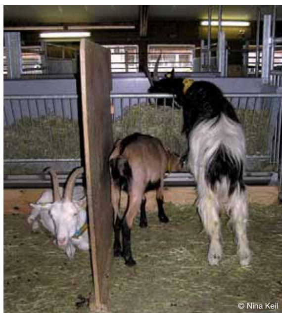
Abbildung 46: Unterteilung des Fressbereichs durch eine Trennwand.