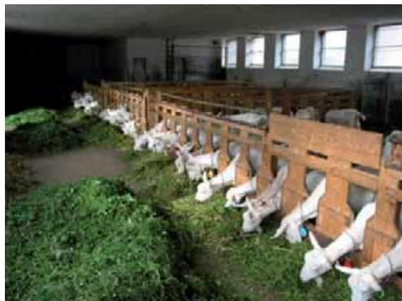
Abbildung 43: Genügend breite Fressplätze ermöglichen relativ ungestörtes Fressen auch bei hochbegehrtem Futter.

Ausreichend Platz am Fressplatz: Ist der Fressplatz zu eng bemessen, können rangniedere Tiere nicht ungestört Fressen. Die Fressplatzbreiten sollte daher mindestens 45 Zentimeter betragen. Dies gilt insbesondere bei behorneten Tieren. Im abgesperrten Fressgitter ohne eine ausreichende Sichtblende werden die rangniederen von den ranghöheren Tieren am Fressen gehindert und der Stress ist in dieser Situation für die rangniederen Tiere erheblich. Je kleiner die Herde ist, desto großzügiger muss die Fressplatzbreite sein. Die Fressplatzbreite kann zum einen durch Vergrößerung des Fressplatzes oder durch Unterbelegung der Fressplätze erreicht werden. Auch bei ad libitum Fütterung ist eine Unterbelegung empfehlenswert, um auch rangniederen Ziegen stressfreien Zugang zum höchstwertigen frisch vorgelegten Futter zu ermöglichen. Von Überbelegung ist in jedem Fall abzuraten. Auch bei ad libitum Fütterung muss unbedingt mindestens 1 Fressplatz pro Ziege angeboten werden.