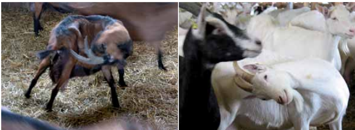
Abbildung 9: Auch für die Körperpflege werden Hörner ausgiebig genutzt

Ziegen nutzen die Hörner im Sozialverhalten vor allem zum Drohen und Imponieren, aber auch zum Kampf und zum Stoßen um andere zu verdrängen. Daneben verwenden Ziegen die Hörner auch zur Körperpflege, d.h. sie kratzen sich damit zum Beispiel am Rücken. Auch wenn sich die Individualdistanzen zwischen behornten und hornlosen Ziegen im Experiment nicht unterscheiden, wird die Individualdistanz bei den behornten Ziegen gewöhnlich mehr respektiert. Dadurch kommt es bei hornlosen Ziegen zu einer etwas höheren Fressplatzbelegung, d.h. mehr Tiere fressen gleichzeitig am Fressgitter, jedoch auch zu mehr ranganzeigenden Verhaltensweisen (z.B. Drohen, Stoßen, Beißen), vor allem mit Körperkontakt. Bezüglich des Ranges sind behornte Ziegen gleichaltrigen hornlosen Herdengenossen normalerweise überlegen.