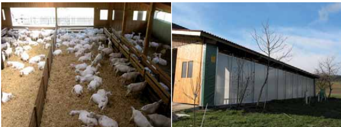
Abbildung 49a: Viel Licht und gute Belüftung sind wichtig.

Auslauf / Weide: ermöglicht Klimareize und Sonnenbaden, der Zugang zu schattigen Plätzen bei Hitze ist wichtig, ebenso eine Überdachung (Zugang zum Stall) bei Regen.