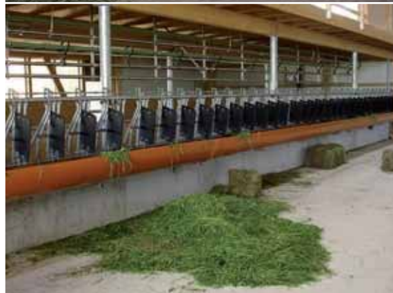
Abbildung 45: Fressblenden an verschiedenen Fressgittertypen.