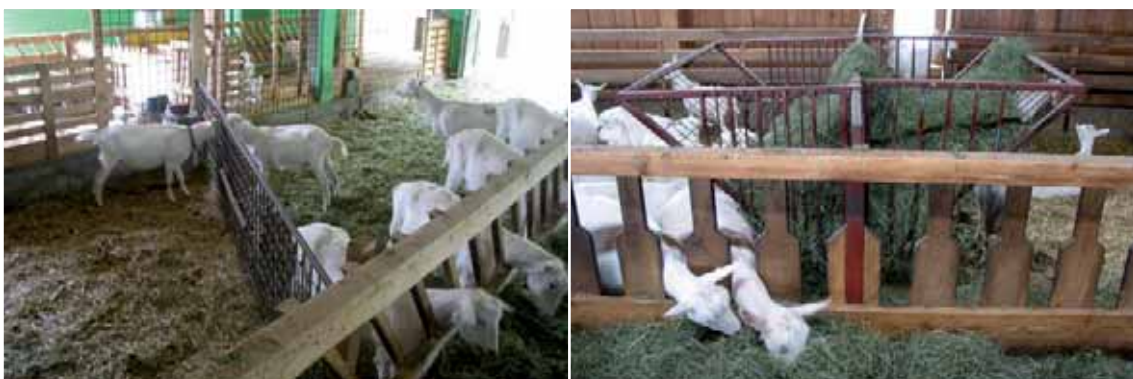
Abbildung 16: In spitzen Winkeln können Tiere schlechter Ausweichen und das Risiko für Verletzungen ist erhöht (siehe Abbildung 36 rechts).