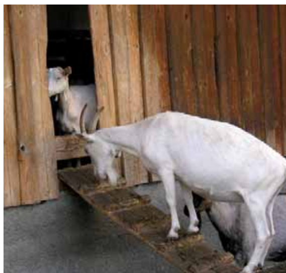
Abbildung 6: Ein schmaler Durchgang führt eher zu Konflikten – hier eine drohende Ziege am Durchgang vom Auslauf zum Stall.