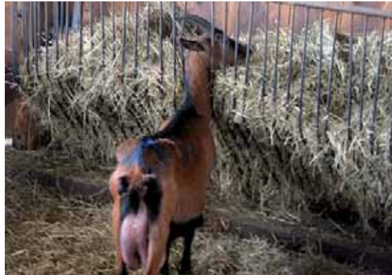
Abbildung 56: In der verbogenen Futterraufe besteht die Gefahr des Hängenbleibens und dann der Verletzung durch andere Tiere, wenn die Ziege der Aufforderung, den Platz zu verlassen, nicht (schnell genug) nachkommen kann.

Sofortiges Reparieren von defekten Fressgittern und anderen, verletzungs-trächtigen Stalleinrichtungen: In defekten oder nicht einwandfrei funktionierenden Fressgittern kann es zu Verletzungen der Tiere kommen; entweder durch die Fressgitter selbst oder durch andere Tiere der Herde, wenn diese das Tier verdrängen wollen und es im Fressgitter festhängt.