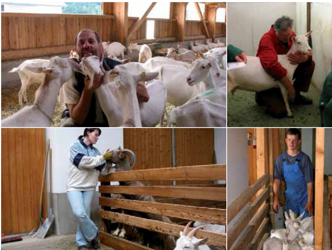
Abbildung 54: Freundlicher und geduldiger Umgang fördert eine gute Beziehung der Ziegen zum Menschen

Angepasster Umgang mit den Tieren: Ruhiger, positiver aber bestimmter Umgang reduziert die Furcht des Tieres vor dem Menschen und damit den Stress. Interaktionen mit den Ziegen, die nicht unbedingt notwendig sind und Stress für das Tier bedeuten, sollten unterlassen werden.