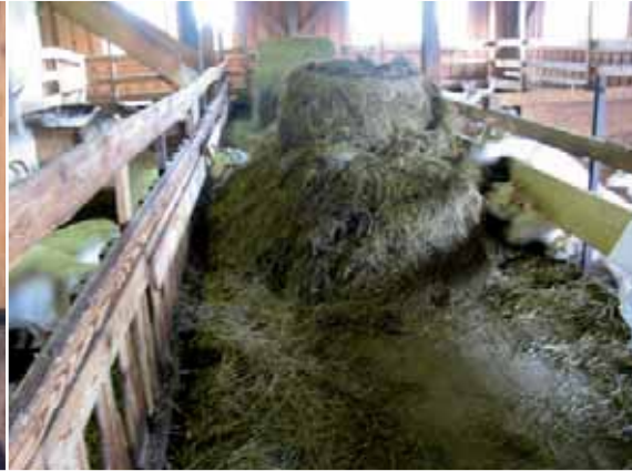
Abbildung 42: Gibt es nur an wenigen Fressplätzen besseres, frischeres oder überhaupt Futter (hier ist der Siloballen von einigen wenigen Fressplätzen aus erreichbar), führt dies zu hoher Konkurrenz und damit Aggression und Verletzungsgefahr.

Ausreichend Platz am Fressplatz: Ist der Fressplatz zu eng bemessen, können rangniedere Tiere nicht ungestört Fressen. Die Fressplatzbreiten sollte daher mindestens 45 Zentimeter betragen. Dies gilt insbesondere bei behorneten Tieren. Im abgesperrten Fressgitter ohne eine ausreichende Sichtblende werden die rangniederen von den ranghöheren Tieren am Fressen gehindert und der Stress ist in dieser Situation für die rangniederen Tiere erheblich. Je kleiner die Herde ist, desto großzügiger muss die Fressplatzbreite sein. Die Fressplatzbreite kann zum einen durch Vergrößerung des Fressplatzes oder durch Unterbelegung der Fressplätze erreicht werden. Auch bei ad libitum Fütterung ist eine Unterbelegung empfehlenswert, um auch rangniederen Ziegen stressfreien Zugang zum höchstwertigen frisch vorgelegten Futter zu ermöglichen. Von Überbelegung ist in jedem Fall abzuraten. Auch bei ad libitum Fütterung muss unbedingt mindestens 1 Fressplatz pro Ziege angeboten werden.