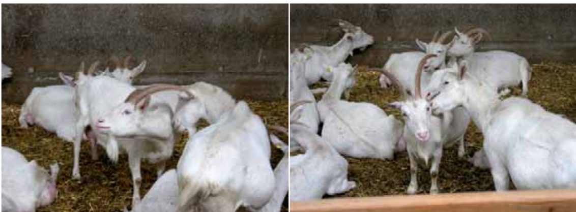
Abbildung 4: Freundschaftliches Beknabbern wird sichtlich genossen.