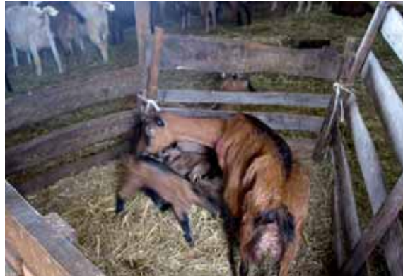
Abbildung 18: Mutter-Kitz-Bucht in der Herde erleichtert die Wiedereingliederung

Zucht auf sozial verträgliche Tiere: Einzelne Tiere, die immer wieder aggressives Verhalten zeigen, können das Verhalten