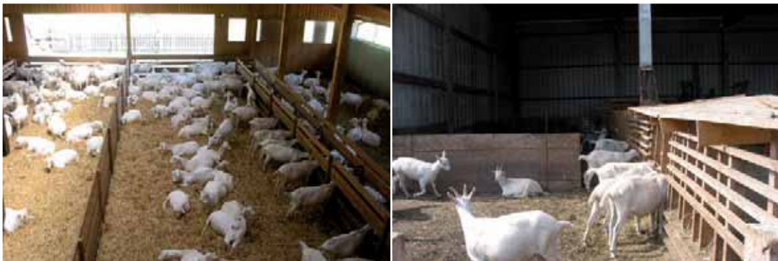
Abbildung 12 (links): Trennwände im Liegebereich unterteilen diesen. Relativ enge Durchgänge können jedoch zu Problemen führen. Mit mehreren Durchgängen können sich die Tiere besser verteilen.