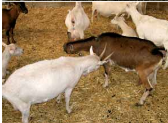
Abbildung 5: Drohen (oben), Drohen und Zurückdrohen (unten)