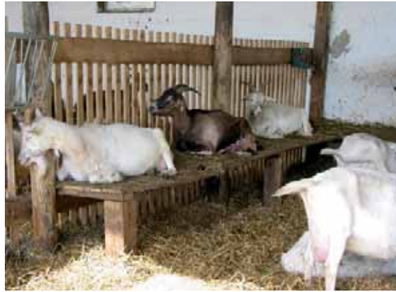
Abbildung 31: In Kleingruppen ist eine Strukturierung der Liegefläche durch erhöhte Ebenen besonders wichtig.

auszuleben und bieten mehr Ausweichmöglichkeiten. Auseinandersetzungen können so vermindert werden. Es ist günstig, die Liegebretter noch mit Trennwänden weiter zu strukturieren (siehe Abbildung 11). Reinigung und Pflege der Liegebretter bedeuten einen erhöhten Arbeitsaufwand, der jedoch durch die richtige Höhe (Tiere können in den Nischen nicht stehen, dadurch fällt kaum Kot an. Höhe der Bretter je nach Größe der Ziegen knapp unter Widerristhöhe) und eine geringe Neigung minimal gehalten werden kann.