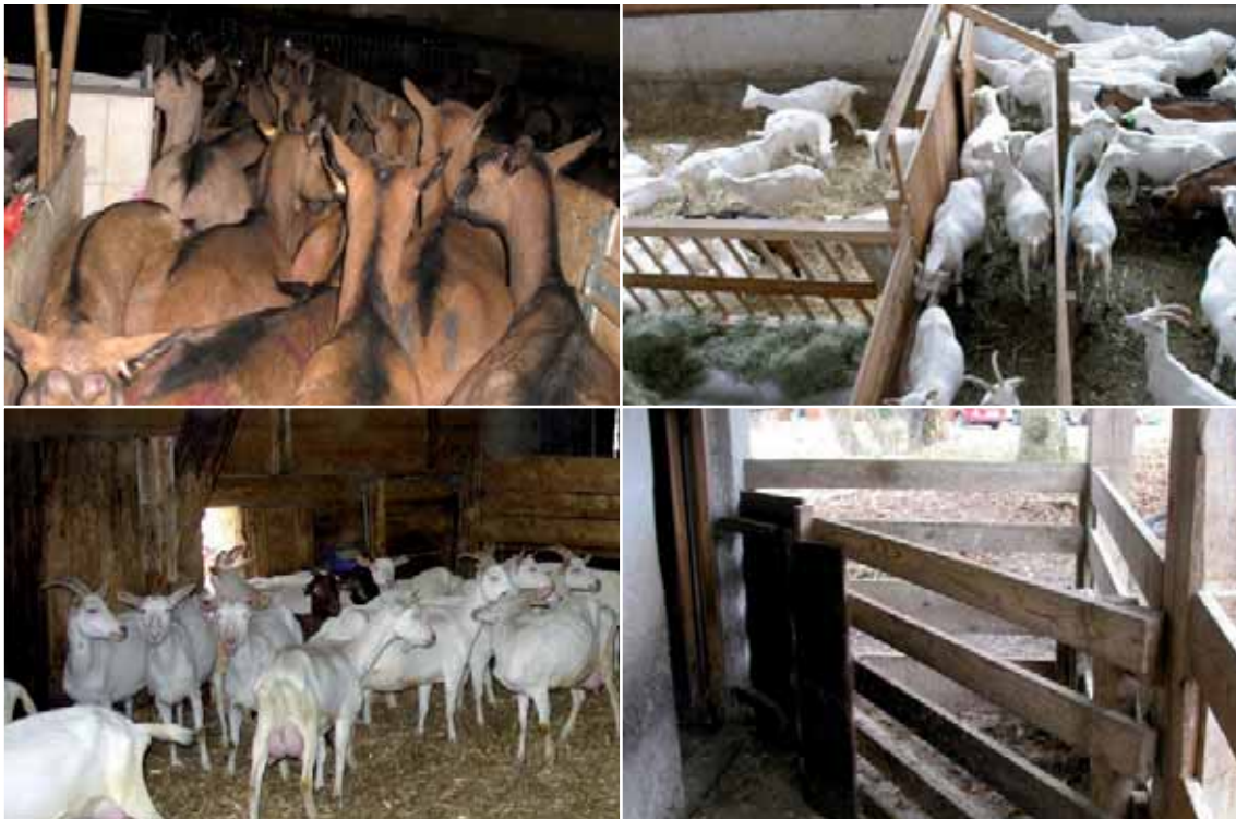
Abbildung 15: Enge Durchgänge oder Engstellen auf Treibwegen, im Stall oder zum Auslauf bergen ein Risiko für Verletzungen und Stress (siehe auch Abbildung 6)

Keine Engstellen im Stall: Zu geringe Gangbreiten oder andere Engstellen im Stall verringern die Ausweichmöglichkeiten von rangniederen Tieren und erhöhen damit den Stress in der Herde und die Gefahr von Verletzungen. Dies gilt auch insbesondere bei der Eingliederung von neuen Tieren oder beim Umgruppieren der Herde. Engstellen im Stall können auch durch Abtrennungen eines Stallbereiches entstehen. Bestehende Sackgassen sollten z.B. durch Anordnung eines Auslaufes entschärft werden. Es ist immer auf die Möglichkeit des Rundlaufes im Stall zu achten. Spitze Winkel bei Abtrennungen sind Sackgassen vergleichbar und müssen unbedingt vermieden werden.