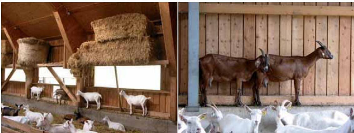
Abbildung 29: Jede Erhöhung – z.B. Betonsockel – wird von den Ziegen genutzt.