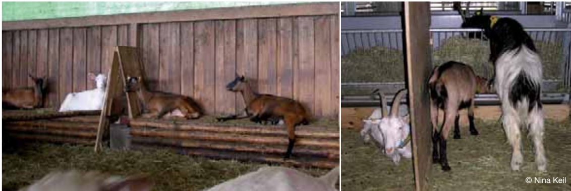
Abbildung 11: Erhöhte Liegefläche mit Trennwänden bzw. Trennwand am Fressgitter – so können auch zwei Tiere nahe nebeneinander liegen bzw. fressen, die sonst viel Abstand zueinander einhalten würden.